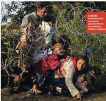
A sinistra: Profughi siriani in Europa. A destra: Profughi afgani in Europa